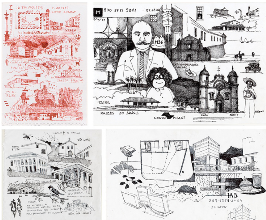
Figura 2 – Notas de clase de la materia “Patrimonio Cultural – Técnicas Retrospectivas” de la FAUUPM. Autoría del profesor de la materia, arquitecto Guilherme Motta.

De ese modo, las primeras preguntas planteadas a los alumnos cuando inician la elaboración de un “proyecto de intervención” son aquellas formuladas por Lucio Costa: “¿cómo, cuándo y quién construyó o ejecutó el edificio?” –momento de reconocimiento y estudio del objeto preexistente. Luego, recuperamos las preguntas elaboradas por Álvaro Siza cuando se deparó con el desafío de la reconstrucción del barrio lisboeta del Chiado, después del incendio de 1989: “¿qué es hoy, qué puede ser, qué ya no puede ser, qué será?” –momento de proyecto. Para concluir, a fin de cuentas, que conocer ya significa comenzar a proyectar.